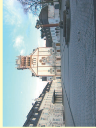
Abtei St. Matthias Trier

Natürlich sollte man sich abends die eine oder andere Weinprobe nicht entgehen lassen: schließlich führt der Mosel-Camino durch eine Reihe bester Riesling-Lagen!